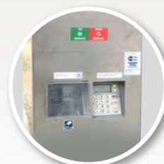
Lecteur de cartes bancaires ONIC 1302 AG