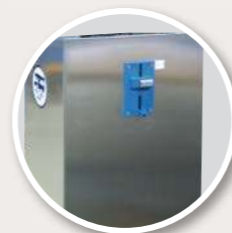
Monayeur ou avaleur de jeton ONIC 1200A